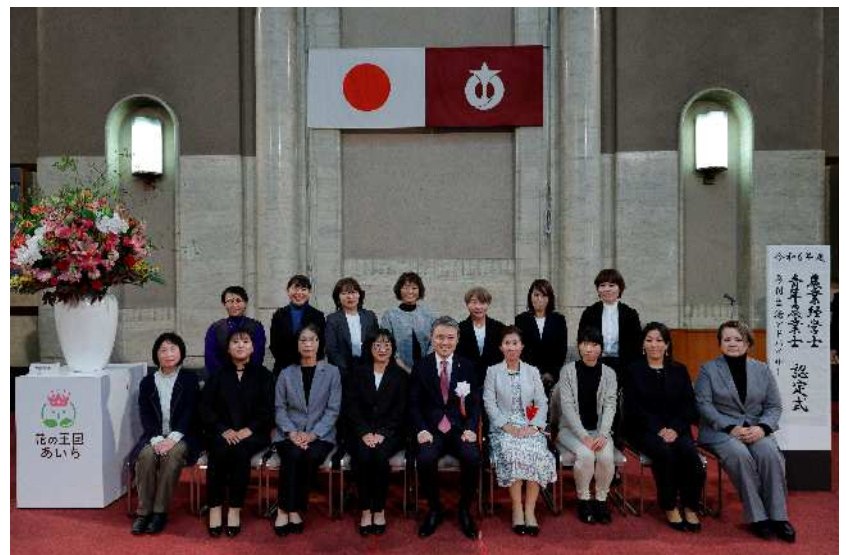
農村生活アドバイザーの皆様