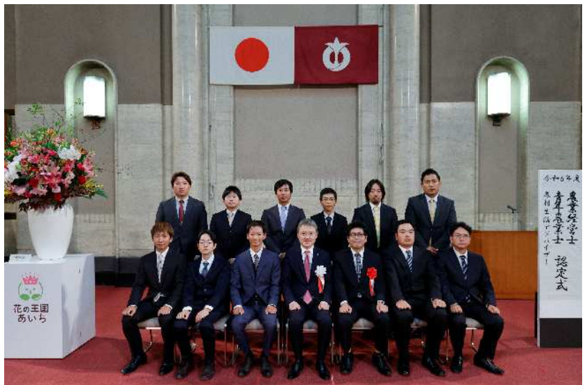
青年農業士の皆様