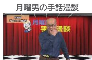
月曜男の手話漫談