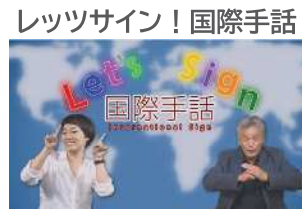
レッツサイン！国際手話