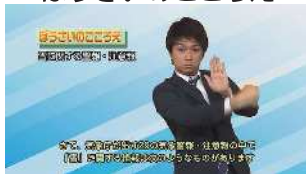
ぼうさいのころえ