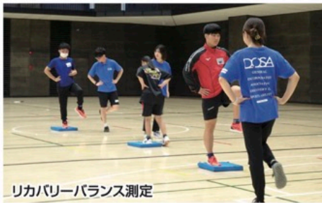
リカバリーバランス測定