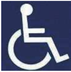
障害者のための 国際シンボルマーク