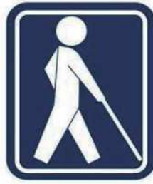
盲人のための 国際シンボルマーク