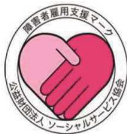
障害者雇用支援マーク