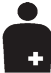
オストメイトマーク