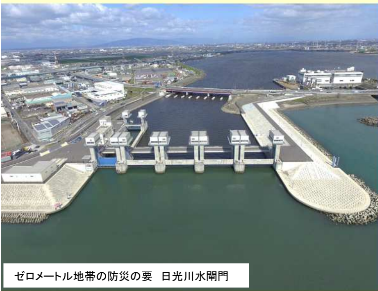
ゼロメートル地帯の防災の要 日光川水閘門