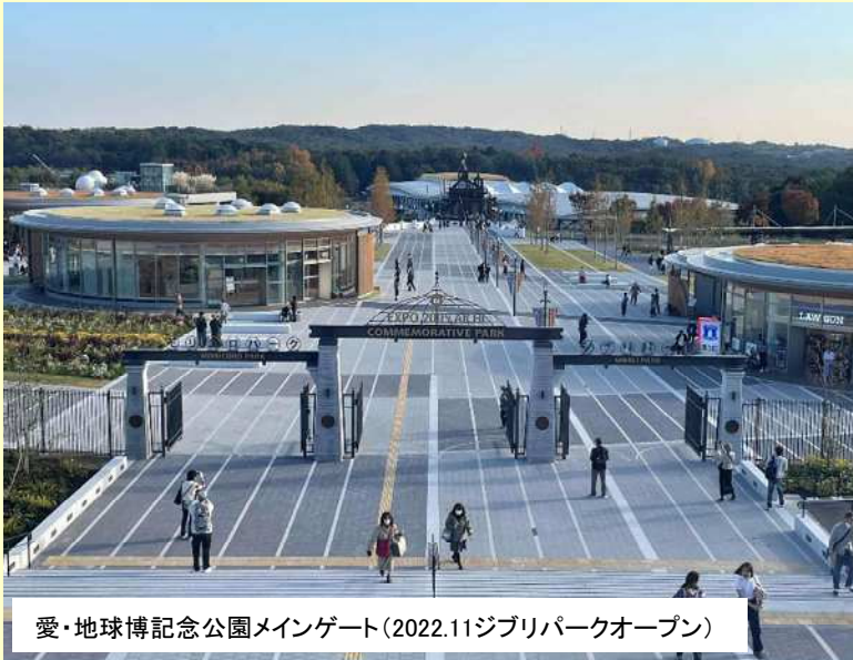
愛・地球博記念公園メインゲート(2022.11ジブリパークオープン)