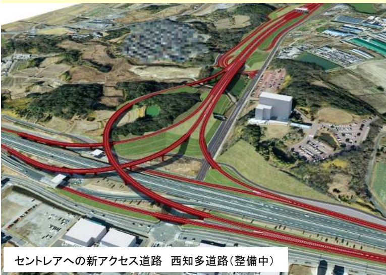
セントレアへの新アクセス道路 西知多道路(整備中)