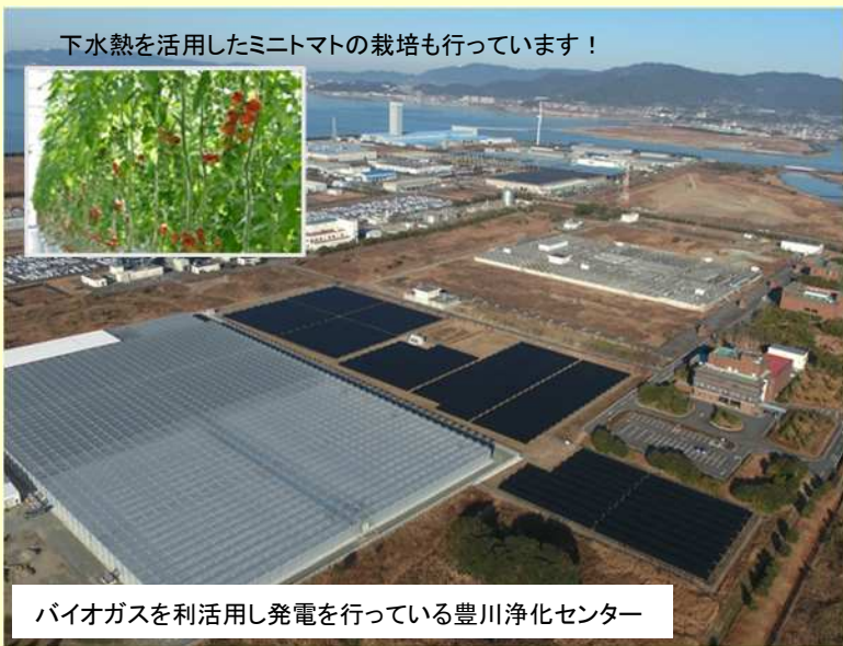
下水熱を活用したミニトマトの栽培も行っています！