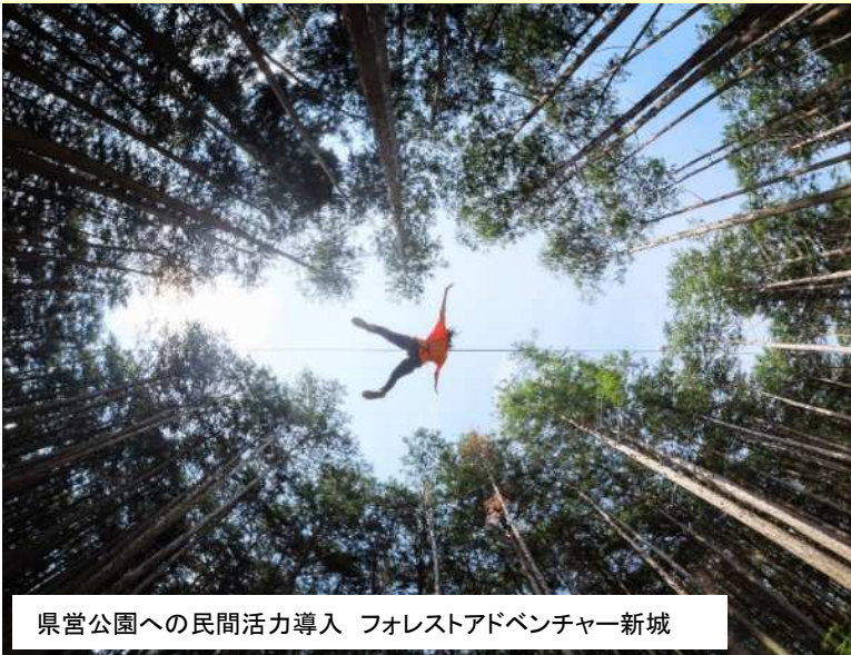
県営公園への民間活力導入 フォレストアドベンチャー新城