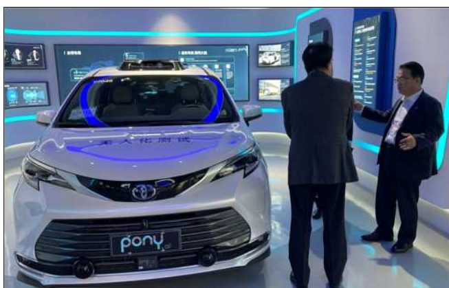
説明を受ける大村知事