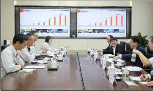
(愛知県記者発表資料より)