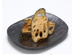
レンコンチップス