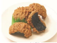
レンコンかば焼き