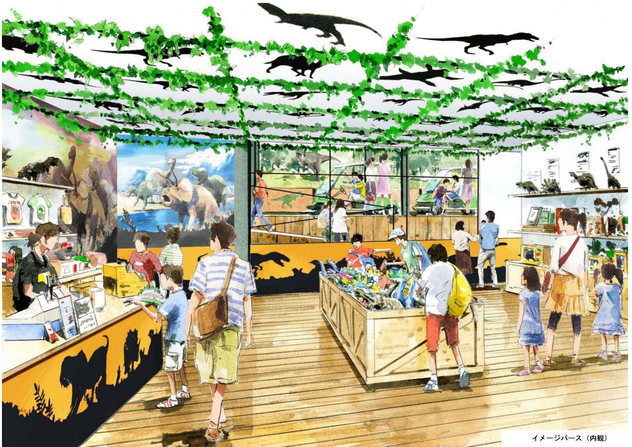
③ イメージパス (内観)