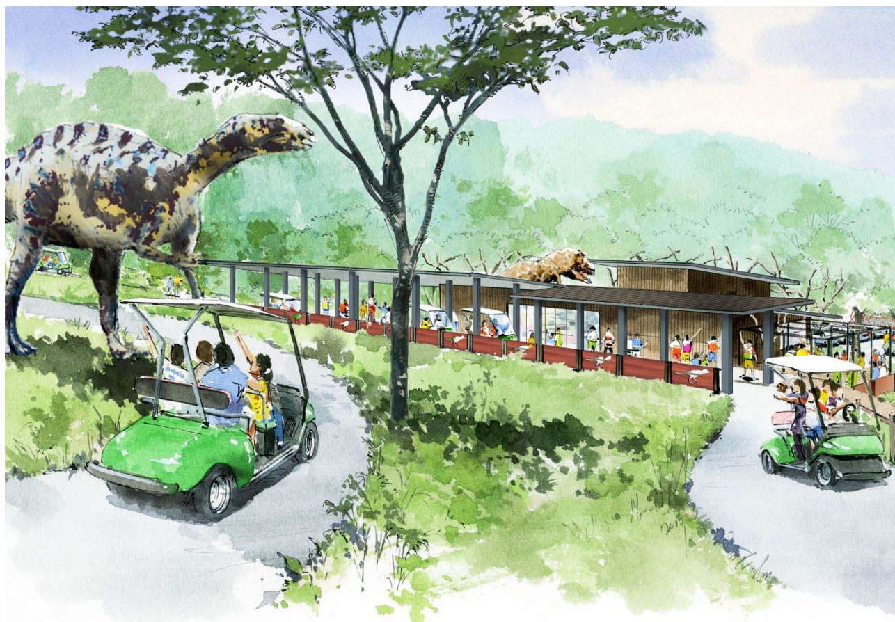
イメージパース (イグアノドン)