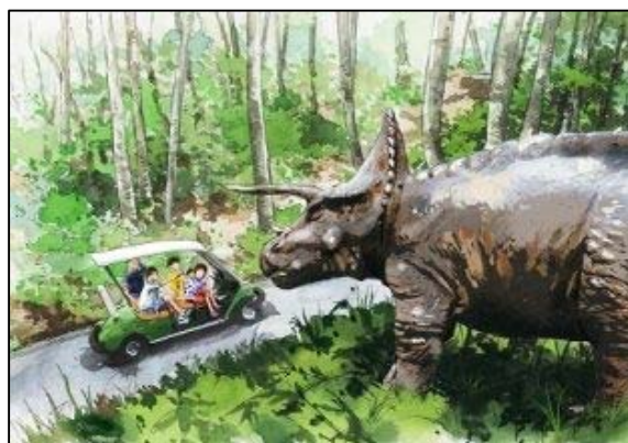
(イメージパース：トリケラトプス)