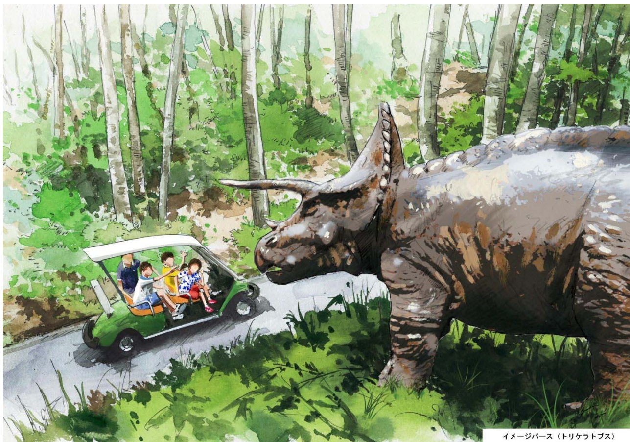
イメージパース (トリケラトプス)