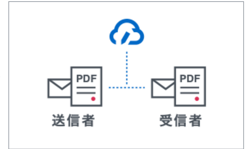
締結後書類を印刷・PDFで保管