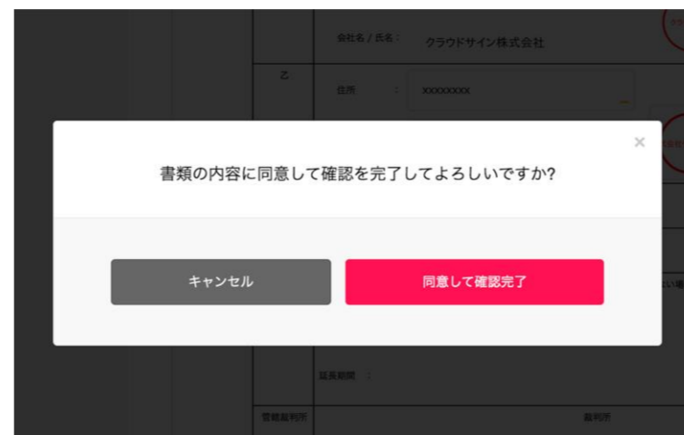
契約書確認・合意