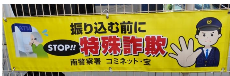
昨年、郵便局入口に取り付けた横断幕

12月13日、2か月に一度の年金支給日、特に12月は年末年始の生活にお金が必要となる時期です。そのような時は特に詐欺に狙われやすいです。学区内にある郵便局の前で愛知県警南警察署生活安全課の協力のもと、啓発活動を実施した。開店前から40分程度であったが、話しをすると多くの方に耳を傾けていただけた。警察署員の方に逆に質問をされている方も何人かいて、詐欺についての関心の高さを感じた。ここでも足を止めてもらえた方にも「闇バイト」「防犯」についても説明をした。