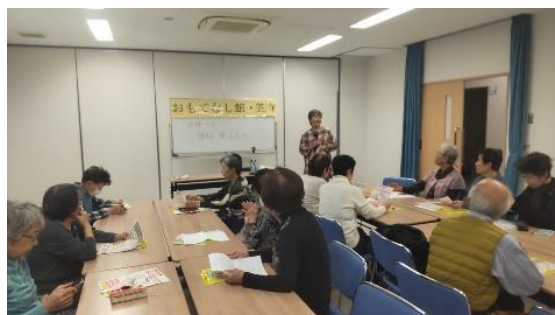
講演会時使用の資料