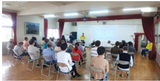
●青パト乗車者講習会