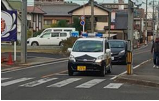
●パトロールの様子