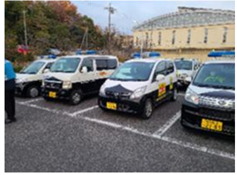
●青パト出発式（瀬戸警察署）