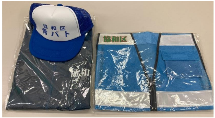
購入したベスト、帽子、ウィンドブレーカ