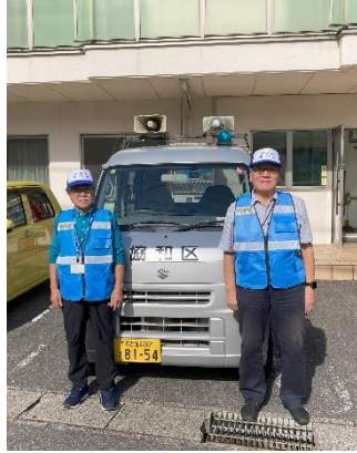
青パト隊ユニフォーム

青色防犯パトロール隊は登下校中における子どもの見守り活動を月8回実施しています。この見守り活動の回数増加や一回当たりの人員増に対応すべく、ベスト、帽子、ウィンドブレーカ10セットを追加購入いたしました。