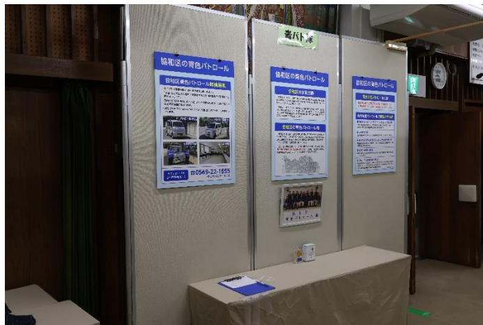
青色パトロールパネル展示とテーブル上に県警表彰と隊員募集のチラシ

2日間での来場者数は約500名で、2階会場の入り口付近に展示場所を確保できたおかげで、親子連れの方々が熱心にパネルをご覧頂きました。