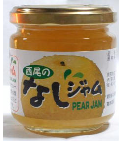
西尾産「豊水」の梨ジャム