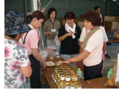
即売会で人気の梨ジャム