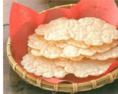
丹念に焼き上げられたえびせんべい