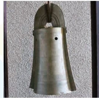
銅鐸はどうやって鳴らすのかな？

https://www.pref.aichi.jp/soshiki/maizobunkazai/