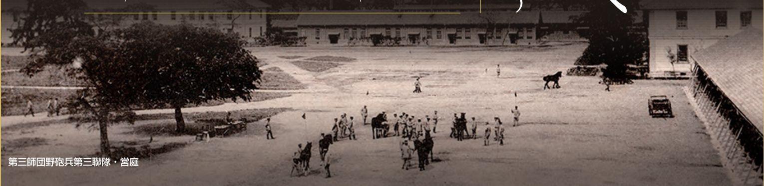
第三師団野砲兵第三聯隊・営庭