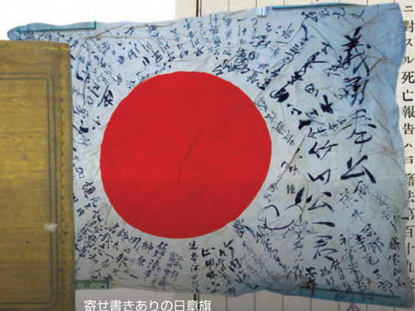
寄せ書きありの日章旗