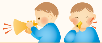
ラッパをふく・笛をふく