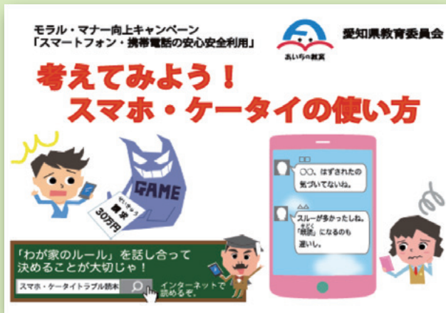
啓発資材(ポケットティッシュ)のイラスト[愛知県教育委員会作成]

ぜひ、ご家庭において、「わが家のルール」を決めるなど、スマートフォン・携帯電話の使い方について話し合ってみてください。