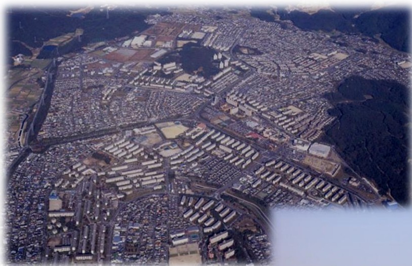
<高蔵寺ニュータウン写真>

そこで、春日井市の高蔵寺ニュータウンの石尾台地区及び高森台地区を対象として、有識者や地元関係者などを委員とする「地域包括ケア団地モデル検討会議」を設置し、新たな地域包括ケアモデルの検討を行います。