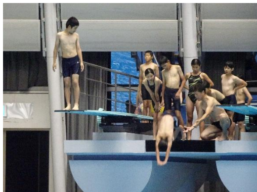
3mの高さからの飛込