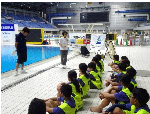
飛込競技についての説明

初回は、飛込競技がどのようなスポーツであるのかを学びました。はじめに、飛込競技についての説明を受け、現役選手による模範演技や飛込台を見学しました。その後、グループに分かれ、競技体験が始まりました。ウォーミングアップを行い、入水の姿勢や足からの飛込を丁寧に教えていただきました。飛び込む高さも、プールサイド、台の上、1mの飛板とレベルアップしていきました。不安や緊張のなか始まった体験でしたが、徐々にチャレンジすることができ、最後は5mの飛込台から飛び込むアカデミー生もいました。安全面についてもしっかりと学ぶことができ、次回の体験に向けて意欲的なアカデミー生の姿が見られました。