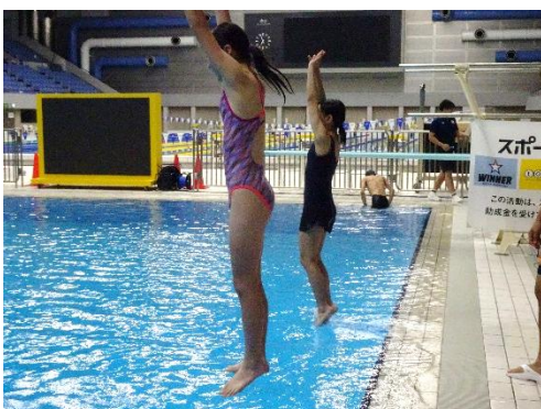
足からの入水（棒飛込）