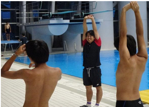
姿勢や腕の伸ばし方の説明

2回目の競技体験も初回と同様、グループに分かれて行われました。前半は、前回習った入水の姿勢や足からの飛込を復習したり、トランポリンを使い空中での姿勢を確認したりしました。後半は、各自の課題に応じて、3mの飛板、5m、7.5m、10mの飛込台にチャレンジしました。初めての高さから飛び込んだ後に互いに拍手したり、高さに驚いているアカデミー生に声を掛けて励ましたりして、楽しく取り組むことができました。