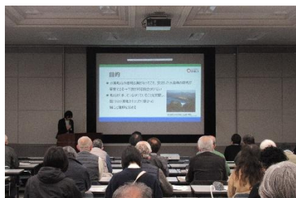
活動発表をする様子

森や緑に関する環境保全活動を実施している方、他の団体の活動を知りたい方、新たに環境活動を始めたい方など、どなたでも参加いただけますので、ぜひお越しください。