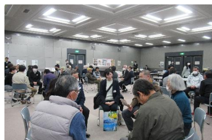
交流会でゲームをする様子

日 時：2026 年 2 月 3 日（火）午後 1 時 30 分～午後 4 時 30 分（午後 1 時開場）