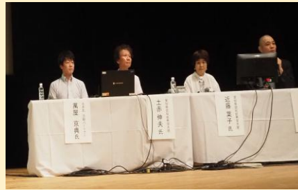
【2024.9認知症県民フォーラム】