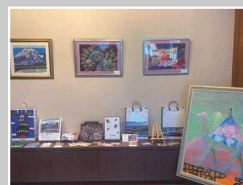
太啓ホールディングスグループ