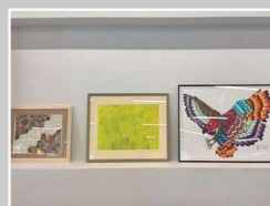
デンソー労働組合