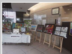
愛知県信用保証協会

愛知県には、障がいのある方の作品を展示する企業等がたくさんあります。 まちなかに広がる小さなギャラリーを、ぜひご覧ください。