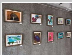
(株)大增コンサルタンツ