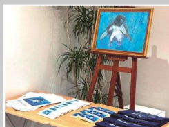
日本空調システム(株)