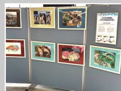
ネットヨタ中部(株)