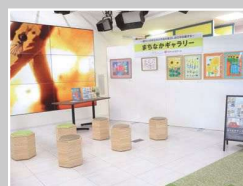
ひまわりネットワーク(株)