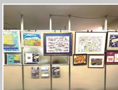
(一社)愛知県測量設計業協会