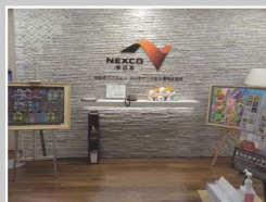
中日本ハイウェイメンテナンス名古屋(株)