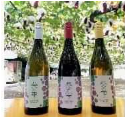
純岡崎産ワイン 「葵の雫」