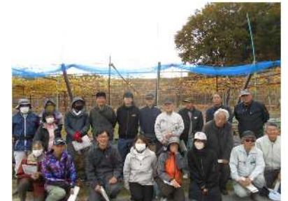
岡崎市果樹振興会

純岡崎産ワイン「葵の雫」 売上高 0円 → 3,630千円 生産量 0本 → 1,500本 (赤、白、デラウェア 各500本)