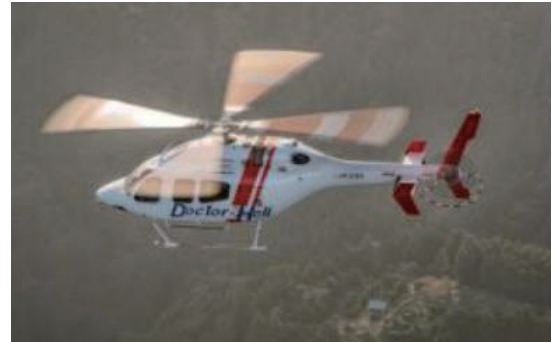
図表2-1-3-9 ドクターヘリ

また、本県は、国の指標によると、尾張地域に2つの医師多数区域が設定される一方で、東三河地域に1つの医師少数区域が設定されています。また、西三河地域において、局所的に医師が少ない「医師少数スポット」が3地域指定されており、2022年度時点で、県内で17の無医地区が存在するなど、医師偏在が課題となっています。