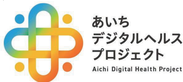
図表2-1-3-6 あいちデジタルヘルスプロジェクト