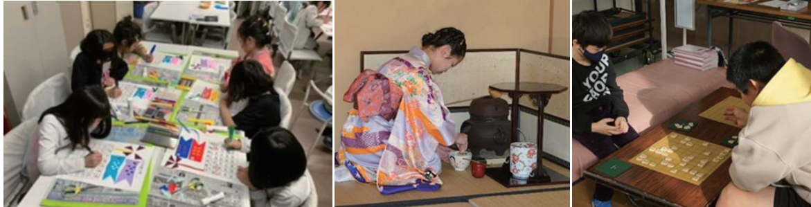
図表2-1-3-13 放課後児童教室（左）及び土曜日の教育活動（中央・右）

また、地域住民等による学習支援「地域未来塾」の支援を通じて、地域・家庭・学校が連携・協働する体制づくりを進めています。2025年度末時点では、「地域未来塾」は17市町村で実施しています。