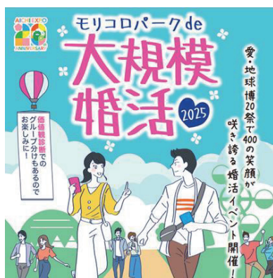
図表2-1-3-1 大規模婚活イベント