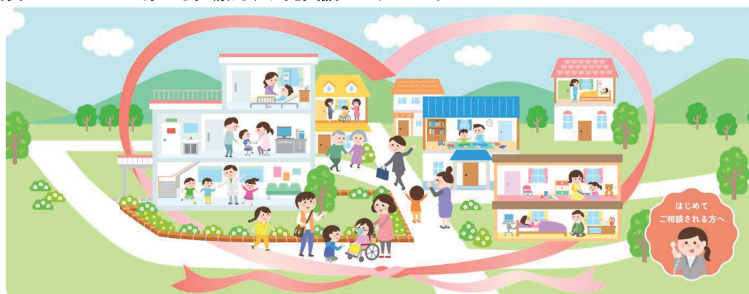
図表2-1-3-11 あいち医療的ケア児支援センターのイメージ

加えて、生活の中で日常的に医療的援助を必要とする医療的ケア児の数が増加している状況を踏まえ、医療的ケア児が居住する地域で適切な支援を受け、健やかに成長できるよう、2022年4月に「医療的ケア児支援センター」を設置しました。同センターでは、どこに相談すればよいかわからない方への相談窓口機能や、必要な情報の提供を行っています（図表2-1-3-11）。