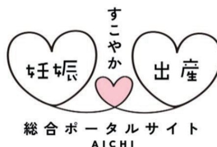
図表2-1-3-3 すこやか妊娠・出産総合ポータルサイト

こうした状況を踏まえ、本県では、子育て家庭を県民や企業が一体となって応援する気運を醸成するため、「はぐみんカード」を発行しています。このカードは、県内の協賛店舗「はぐみん優待ショップ」で提示することで、店舗や施設が独自に設定する商品の割引や