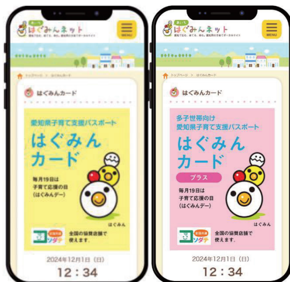
図表2-1-3-4 はぐみんカード（デジタル）