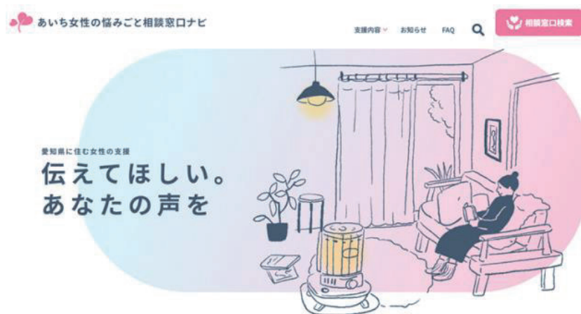
図表2-1-3-12 あいち女性の悩みごと相談窓口ナビ

また、2024年度から女性支援を行う相談員等を対象に、ケースワークのための実践的な支援技術を身に付けることができる内容の研修を新たに実施し、県及び各市町村の女性相談支援員等の資質向上を図っており、これまでに累計921人が参加しています。