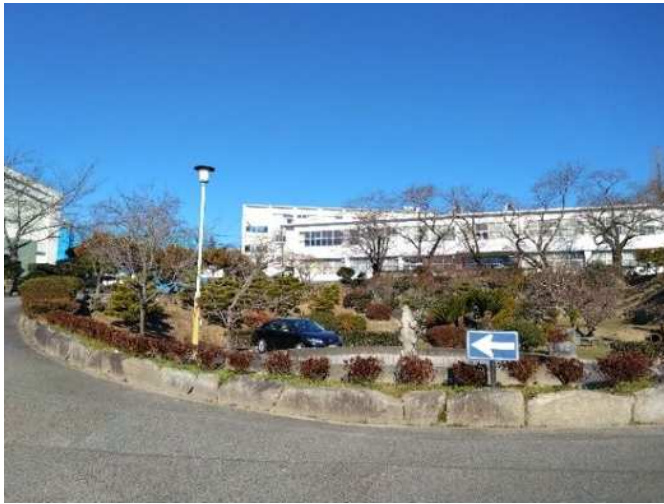
学校の施設用地の緑化（岡崎市） 校庭緑化整備事業

学校やスポーツ施設、庁舎等、県民の身近な施設において、施設の利用者に心地よさを感じてもらえる緑の空間を提供するとともに、環境教育やレクリエーション活動等、利用者の種類や施設の類型に応じて多目的に活用できるよう緑地の適切な保全及び緑化の推進に取り組みます。