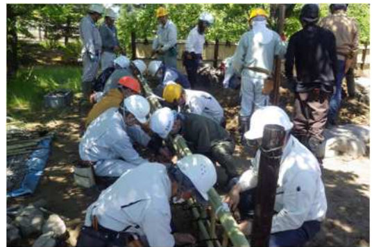
緑化木生産者等への指導・研修 愛知県植木センター（稲沢市）

また、愛知県植木センターでは、緑化用樹木の生産・造園に関する調査研究を行うとともに、緑化木生産者及び造園業者等へ生産・造園技術に係る指導・研修により緑化の普及に取り組みます。