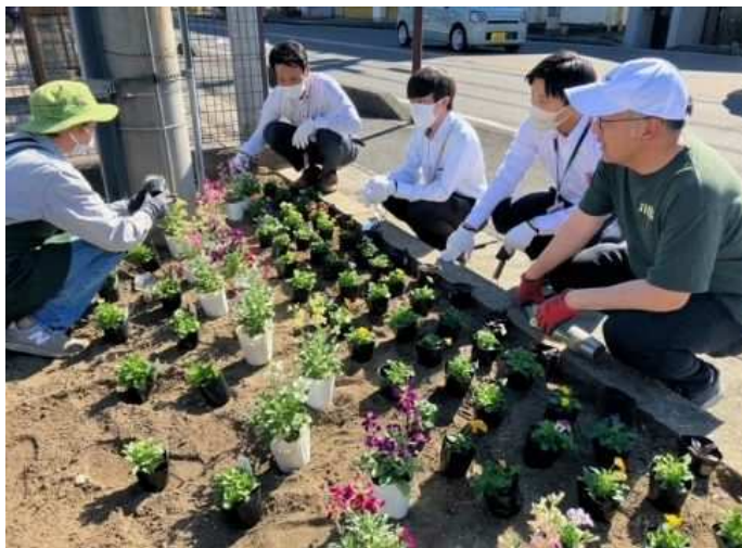
民有地の緑化（一宮市） 花の王国あいち需要拡大推進事業のうち 花のまちづくり推進事業

緑地の少ない都市部において、民有地に緑を積極的に導入することで公益的機能の維持増進が図られます。商業施設や工場等の緑化活動を支援するとともに、家庭や地域単位での緑化活動が幅広く展開されるよう、普及啓発に取り組みます。