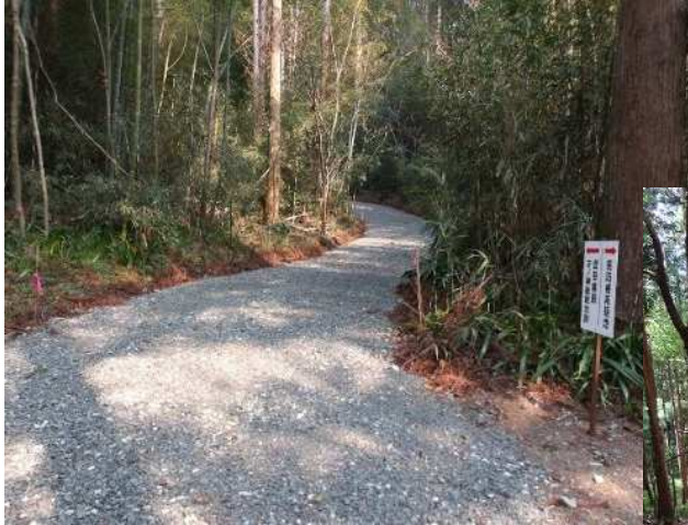
森林・里山の保全・活用（新城市） あいち森と緑づくり事業 里山林整備事業

また、民有林と国有林が隣接する森林においては、効率的かつ一体的な整備が可能となるよう連携して保全・活用を推進していきます。