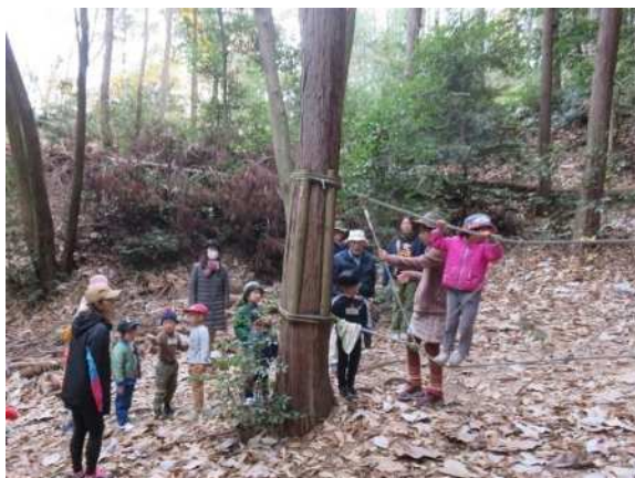
あいち海上の森センター管理運営事業 (瀬戸市) 自然体験教室

また、森林由来のJクレジットは、森林の適切な管理による二酸化炭素吸収量をクレジット化したものであり、その販売収益を活用することによりさらに森林整備が進むことから、地球温暖化の防止や生物多様性の保全に寄与するため、積極的な活用を促進します。