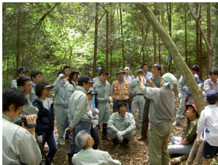
企業等との連携・協働による森林整備・保全活動（瀬戸市）

近年、社会貢献活動が盛んになり、その活動の場を森林整備や緑化活動に求める企業等が増加しています。このため、企業や小中学校、高等学校、関係団体、NPO、自治会等、多様な主体との連携・協働による取組を促進していきます。