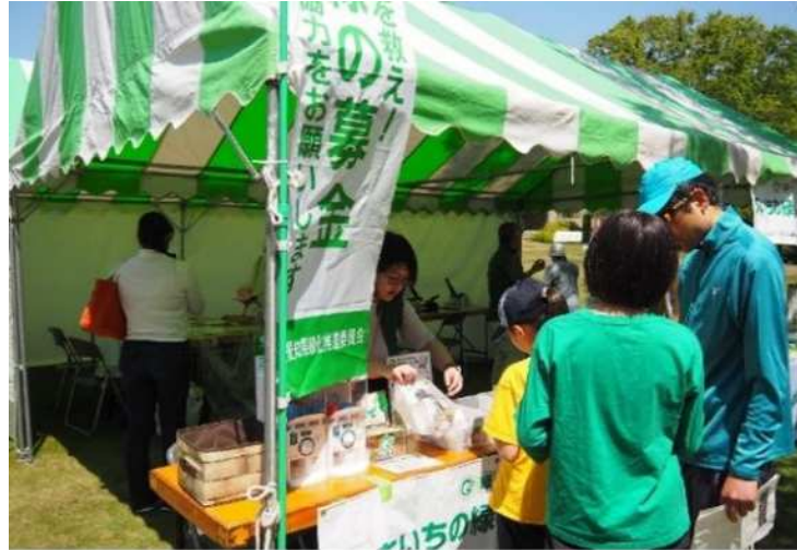
(公社)愛知県緑化推進委員会による緑化の普及啓発（豊田市）

関係団体の事業に県が協力し、連携して行うことにより、幅広い層の県民に対して緑化に関する普及啓発が可能となり、緑化活動への積極的な県民の参加を促進します。