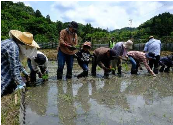
あいち海上の森センター管理運営事業 (瀬戸市) 里と森の教室

森林・里山、河川、ため池、海岸等の緑には、環境によって様々なタイプの生態系が形成されています。これらが相互に関連し、生態系の多様性が確保されていることから、緑の保全・活用にあたっては、多種多様な野生動植物が生息・生育し続けられるよう、生物多様性の保全に配慮していきます。