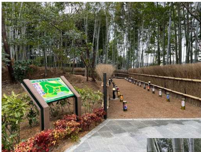
緑地の保全・創出（大府市） あいち森と緑づくり事業 都市緑化推進事業のうち 身近な緑づくり事業

都市部に残された樹林地等の緑は、地域住民の QOL（生活の質）を高めるために欠かせないものであることから、適切に保全・活用することにより、大切な緑を次世代に残す取組を進めます。