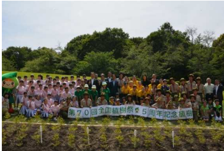
県民への緑化の普及啓発（尾張旭市） 第70回全国植樹祭5周年記念植樹