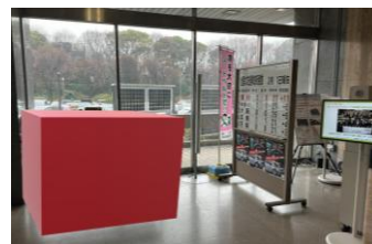
図 4：西庁舎正面入口