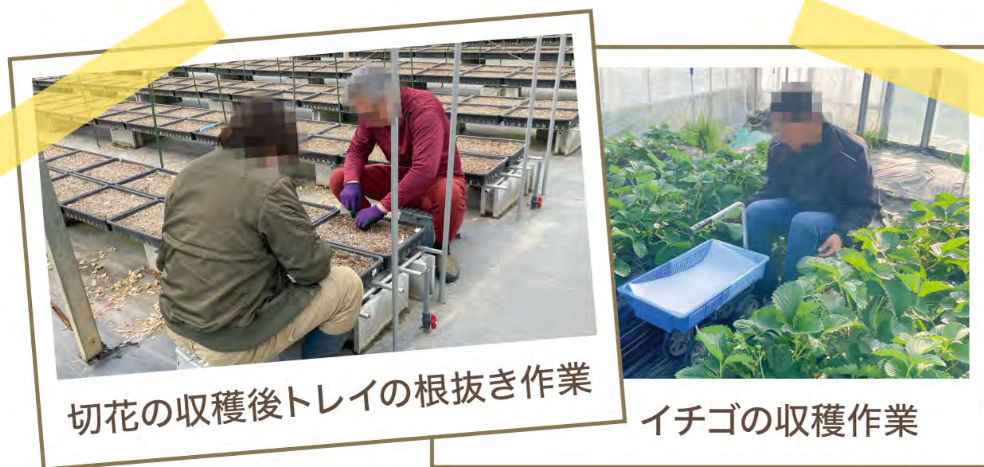
切花の収穫後トレイの根抜き作業

福祉事業所等に農作業を請け負ってもらう取組です。農業者は労働力不足の解消に、障がいのある方等は生きがいや自信の創出などにつながっています。