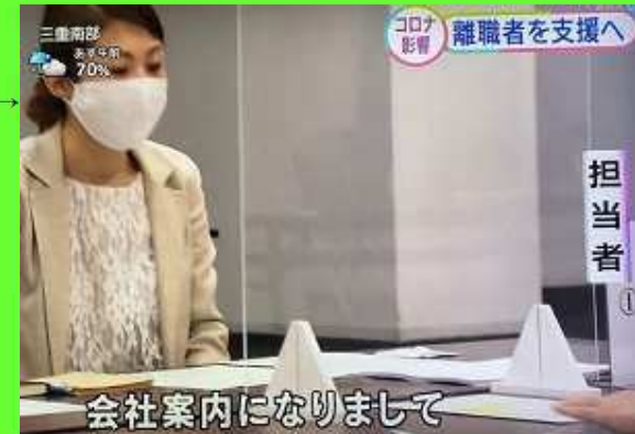
会社案内になりまして