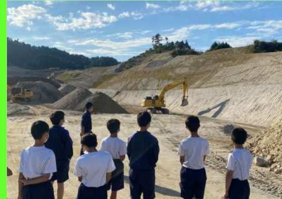
← 丸普採掘現場見学会