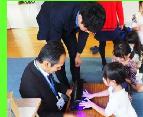
→ ブラックライトで手洗いチェック！ しっかり洗えてるかな？