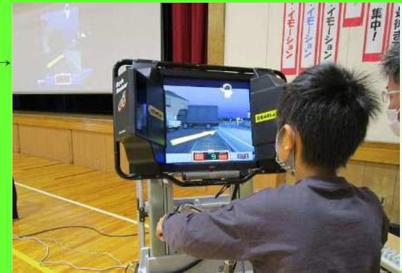
自転車シミュレーター体験