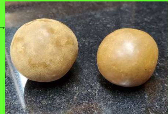
光る泥団子ワークショップ