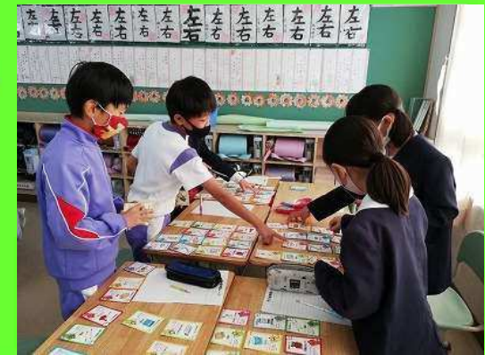
防災ゲームを楽しむ →