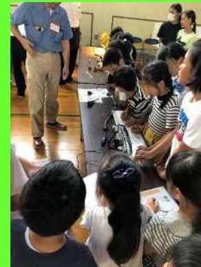
太陽光パネルに光が当たって扇風機が動きました。