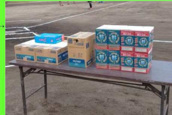
当社提供の副賞 優勝チーム：公式球 参加賞：スポーツ飲料