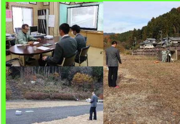
← 会社概要説明、測量実習、ドローン操作