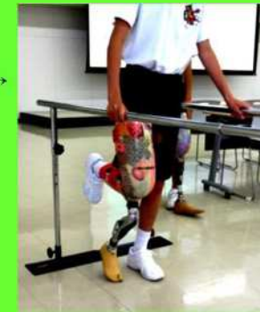
体験をする楽しみ →