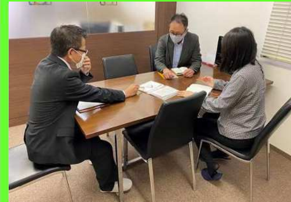
← ミーティングの様子