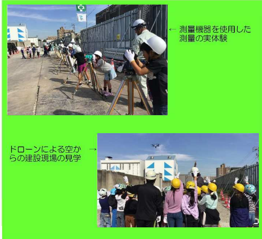
← 測量機器を使用した測量の実体験