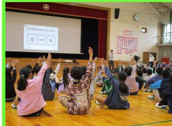
← 交通安全講話を聴く 牛久保小学校3年生