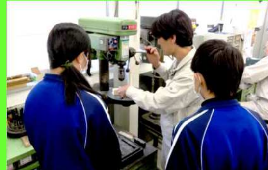
← 難しい作業は見学！