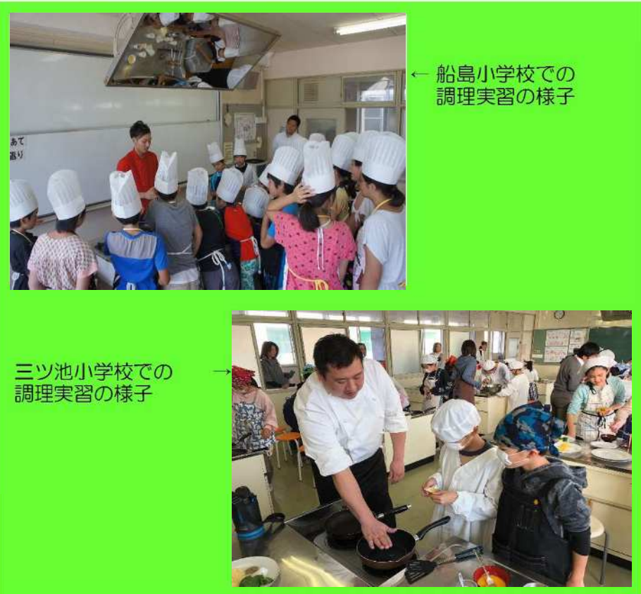
← 船島小学校での調理実習の様子