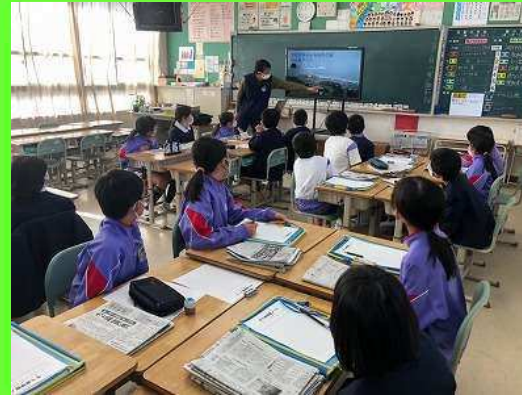
← 過去の災害について説明を聞く