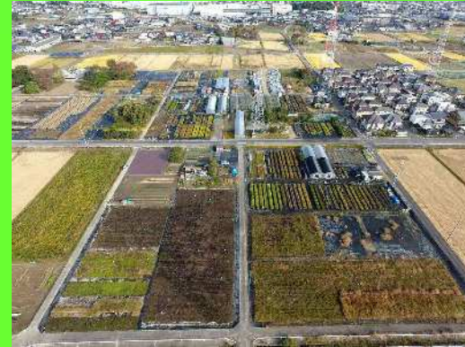
← 在来種育成ラボ全景 (空撮)