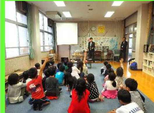
← お掃除クイズに元気に手を挙げる子供たち