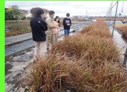
大学生への事業説明 →