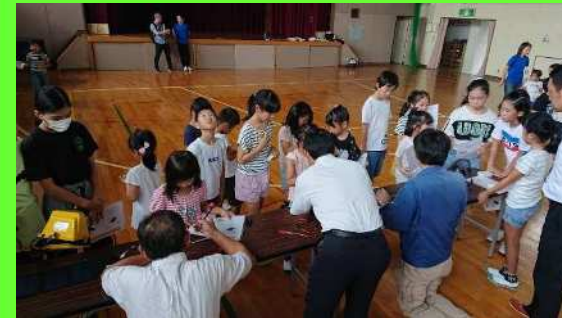
← 太陽光で発電するための装置を児童の皆さんが作りました。