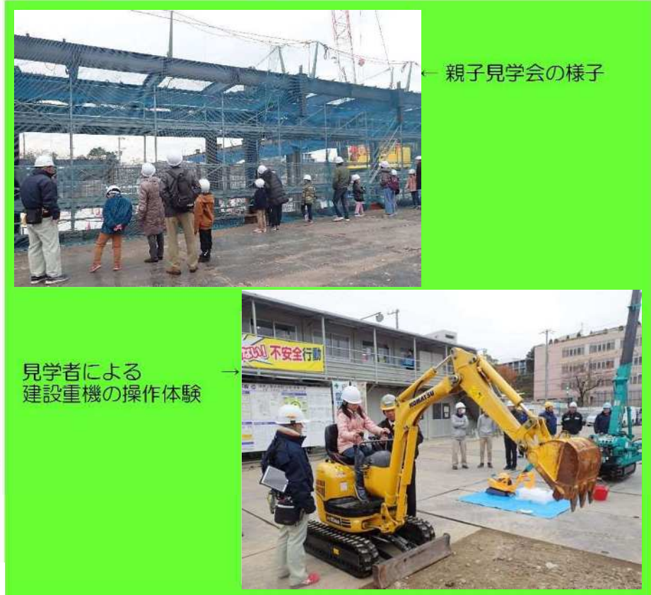
親子見学会の様子