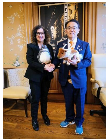
ファイゲンバウム副学長との記念品交換