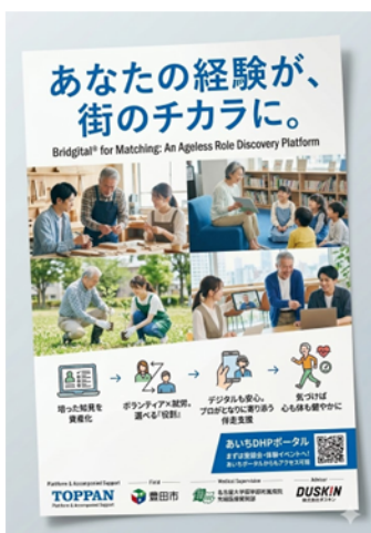
告知チラシイメージ