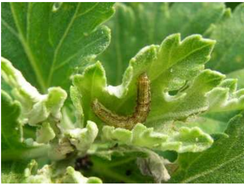
図2 キクの葉を食害する幼虫

薬剤感受性の低下を防ぐため、同じIRACコードの薬剤は連用しないようにしましょう。なお、農薬の散布に当たっては、ラベルの表示事項を守るとともに、他の作物や周辺環境への飛散防止に努めましょう。登録のある農薬については、農林水産省「農薬登録情報提供システム」( https://pesticide.maff.go.jp/ )を参照してください。