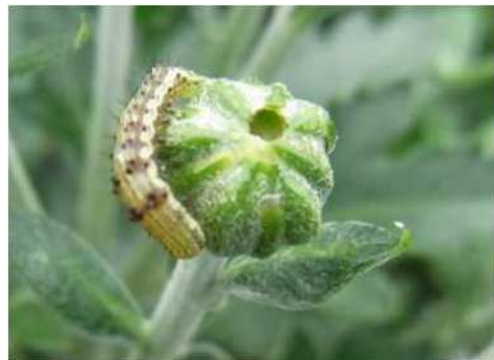
図3 キクの花蕾を加害する幼虫