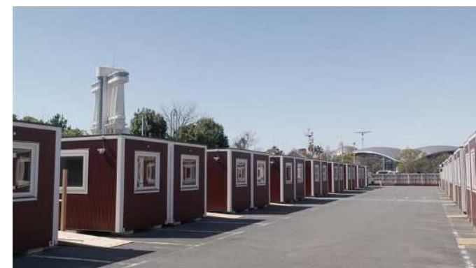
ガーデンふ頭に設置された 移動式宿泊施設