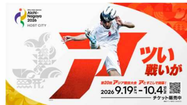
デジタルサイネージ広告の一例

大会のコアグラフィックス等による統一的なデザインの フラッグパネル、横断幕等を名古屋駅やオアシス21、豊橋駅など 県内各所で掲示