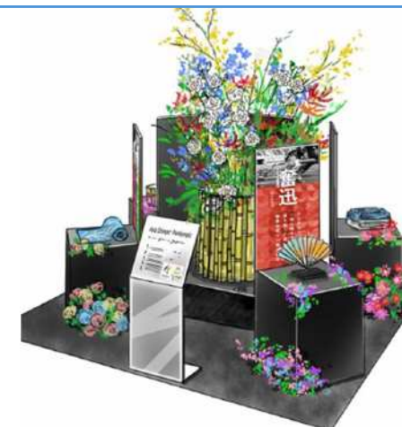
③名古屋駅設置の装飾イメージ