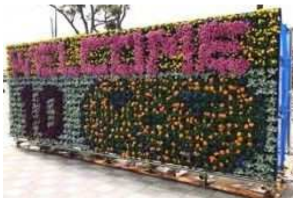
②宿泊拠点の屋外装飾イメージ