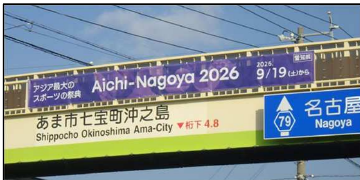
横断歩道橋への横断幕掲示