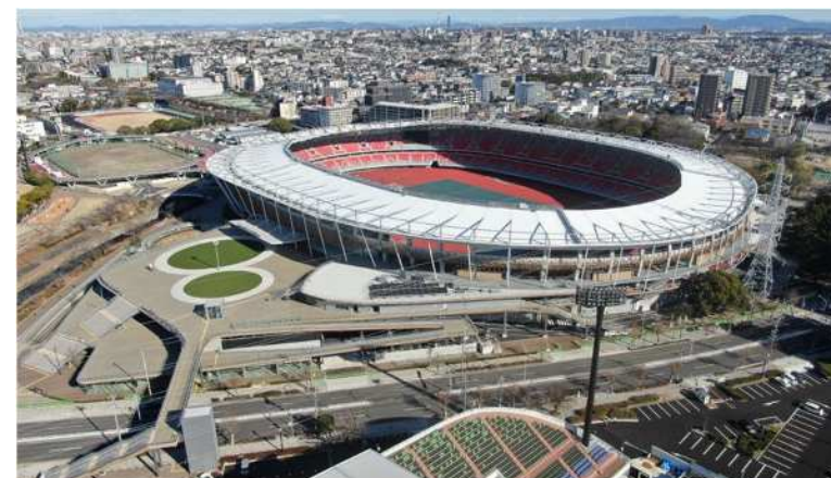
名古屋市瑞穂公園陸上競技場

※アジア競技大会 開会式9月19日・閉会式10月4日 で使用 アジアパラ競技大会 開会式10月18日・閉会式10月24日 で使用 競技では陸上競技の主な会場