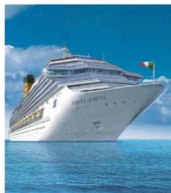
ホテルシップとなる クルーズ船