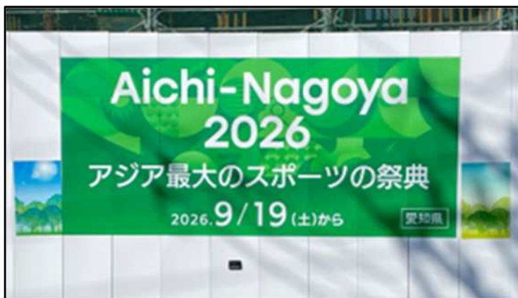
工事箇所の仮囲いへのステッカー掲示