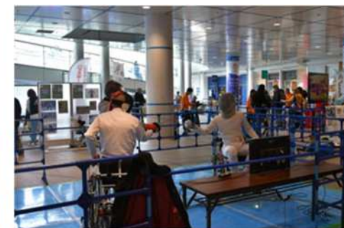
パラフェンシング