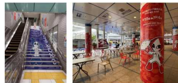
シティドレッシングの例