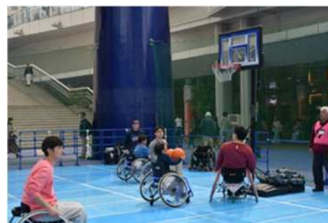
車いすバスケットボール