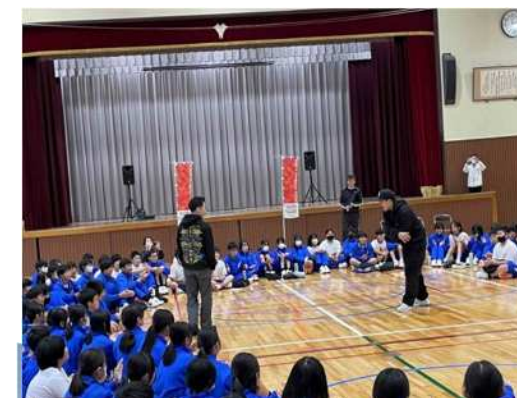
(常滑市内の小学校でブレイキン出前講座)