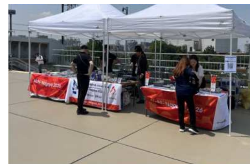
(ジャパンパラ陸上競技大会でのブース出展)