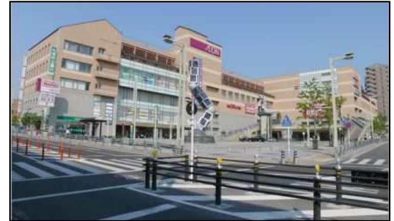
イオンタウン有松

「有松オフィス」には、会場ごとの運営に向けた調整を組織全体で進めるため、原則として全課室が入居