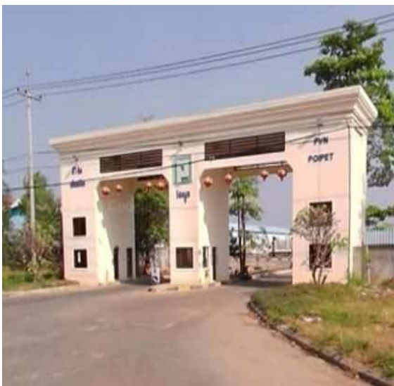
(左) 詐欺拠点の門扉