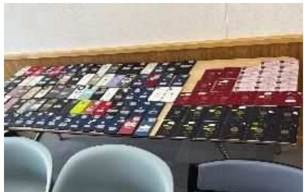
(右) 犯行グループが渡航者から没収していた携帯電話、パスポート、身分証等