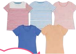
オーガニック コットンTシャツ