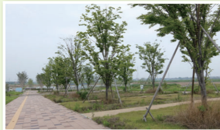
▲ケヤキ並木プロムナード