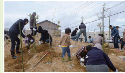
▲ドングリの丘での植樹(県民との協働作業)