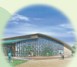
水辺の学習館のイメージパース