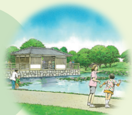
ハス池のイメージパース