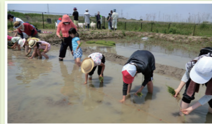
▲田んぼでの田植え(県民との協働作業)