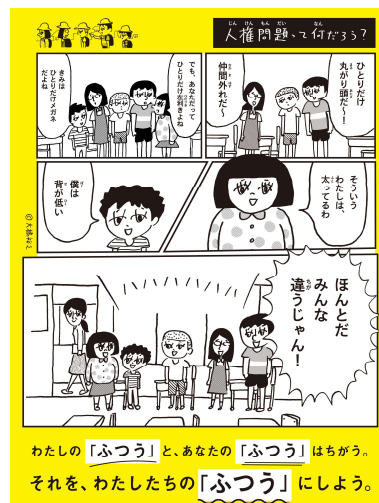
人権啓発ポスター