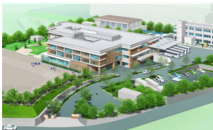
大府もちのき特別支援学校（イメージ）