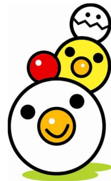
愛知県子育て応援マスコット キャラクター はぐみん

結婚、出産は個人の自由な意思や価値観に基づくものではありませんが、今後も本県が活力を維持していくためには、安定した雇用環境、ゆとりある暮らしの中で、県民が安心して家庭を築き、子どもを生き育てることができるような社会づくりに取り組んでいく必要があります。