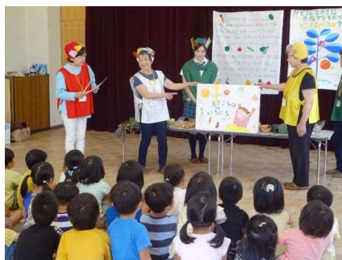
「保育園での食育紙芝居」