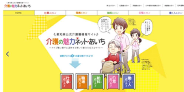
介護職情報サイト 「介護の魅力ネット・あいち」