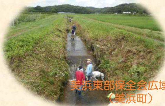
美浜東部保全会広域協定 （美浜町）