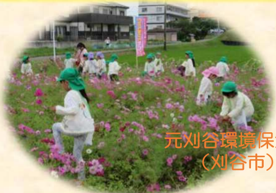
元刈谷環境保全会 （刈谷市）