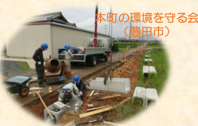
本町の環境を守る会 （豊田市）