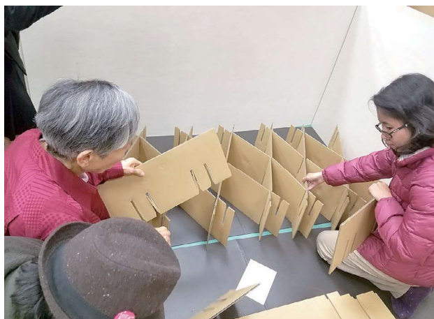
段ボールベッド組み立て訓練の様子

岡山で暮らす外国人は、年々増加しています。引き続き、県国際交流協会や市町村と連携し、災害時多言語支援センターの設置・運営や、災害時の通訳・翻訳ボランティアの登録制度の運用など、災害時における外国人の支援体制づくりに取り組んでいきたいと考えています。