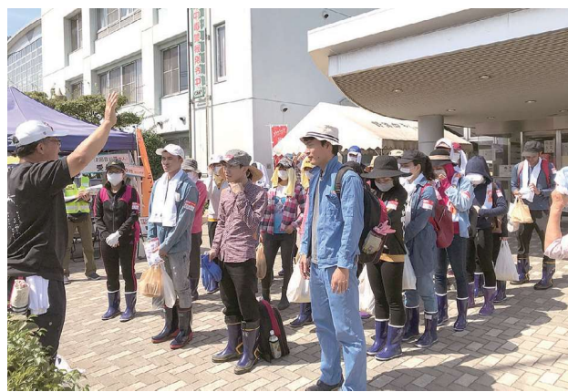
安浦地区で4班に分かれて活動 出発前に諸注意を聴く様子