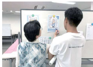
ボランティア希望者には、プリントと口頭で説明