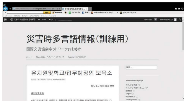
2013年度に準備したネットワークの災害時多言語ブログの画面

設置訓練」は、北部は箕面市で、南部は富田林市で、いずれもまる1日かけて実施した。この日のために、災害時にいつでもオープンにできる4言語（英、中、韓、やさしい日本語）でのブログも開設。当日は仙台市で使われた情報を使用してもらい、短時間で情報を選別し、他県（島根県と仙台市）の国際交流協会に翻訳協力を依頼、返送された原稿を多言語ブログにアップする班と、避難所巡回用に自分たちで必要な情報を選んで翻訳する班との2つに分かれて演習した。長時間の訓練を通して「どの情報を選別すべきか」など、正解のない中で次々と決断を迫られることの難しさ、情報伝達の奥深さを身をもって学んだ。