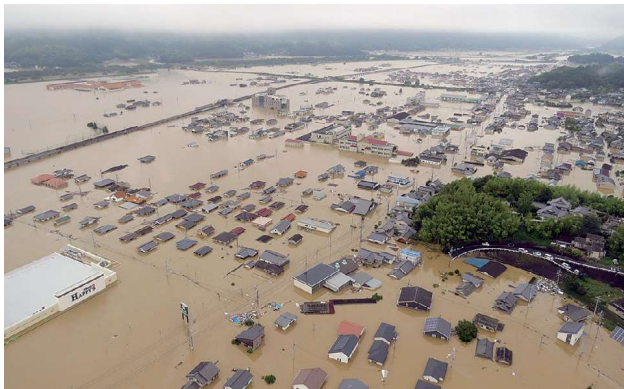
災害時の倉敷市真備地区の様子 (2018.7.7)

災害発生からこれまで、国や市町村、関係団体と緊密に連携しながら、復旧・復興に向けたさまざまな取り組みを進めているところですが、被災者の生活や被災地域の経済の復興には、まだ多くの時間を必要とする状況にあります。