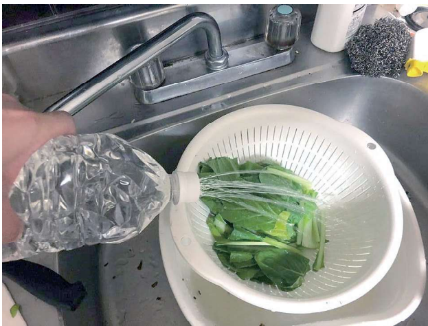
学習者のFBから一節水の呼びかけ

7日の日本語教室は危険な地域が多いので開かず、FBを使って教室を休むこと、危ないから外出しない方がいいこと、水を溜めておくことなどを知らせました。さらにボランティアスタッフに、担当している学習者の安全確認をするようお願いしました。教室を開いている広地区は外国人住民がたくさん住んでいますが、周辺の山が崩れて断水になり、交通が遮断されスーパーの棚はガラガラになってしまいました。