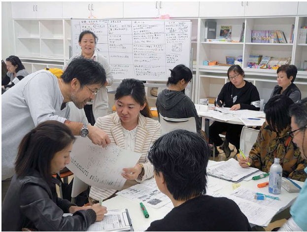
2013年11月1日実施の多言語支援センター設置訓練 (@箕面市立多文化交流センター)

設置訓練」は、北部は箕面市で、南部は富田林市で、いずれもまる1日かけて実施した。この日のために、災害時にいつでもオープンにできる4言語（英、中、韓、やさしい日本語）でのブログも開設。当日は仙台市で使われた情報を使用してもらい、短時間で情報を選別し、他県（島根県と仙台市）の国際交流協会に翻訳協力を依頼、返送された原稿を多言語ブログにアップする班と、避難所巡回用に自分たちで必要な情報を選んで翻訳する班との2つに分かれて演習した。長時間の訓練を通して「どの情報を選別すべきか」など、正解のない中で次々と決断を迫られることの難しさ、情報伝達の奥深さを身をもって学んだ。