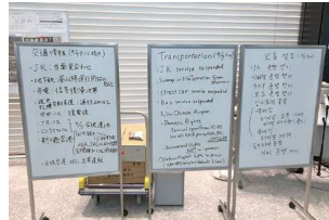
避難所における多言語案内