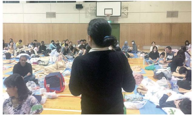
2018年6月19日の夜、通訳リーダーの説明に聞き入る避難外国人たち

2018年6月18日、震度6弱の揺れが箕面市を襲った。休館日だった箕面市立多文化交流センターも被災し、翌日から避難所巡回と複数言語での情報提供を開始したところ、これまでの経験が大いに役立った。最寄りの避