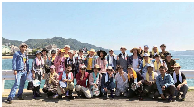
酷暑の中、天応地区での活動を終えて

その後学習者が教室やFBで呼びかけ、災害ボランティア活動に参加しました。被害の大きさに驚いた1回目の参加者が「つらいことは、みんなで協力して乗り越えましょう。」と呼び掛け参加者の輪はひろがり、4回延べ138人（学習者110人・スタッフ28人）が汗を流しました。お手伝いしたお宅の方達が喜んでくれて参加者