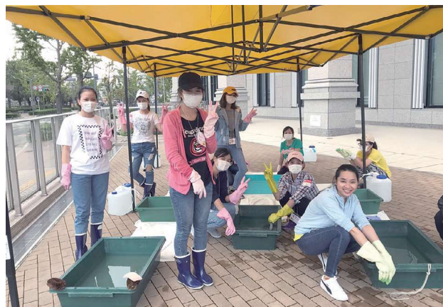
男性は音戸地区へ、女性はセンターでサポート活動

の勤務先にお礼の電話やメールをくださったり、全国各地の多文化共生マネージャーや日本語学習支援者が応援してくれたり、嬉しいことがたくさんありました。