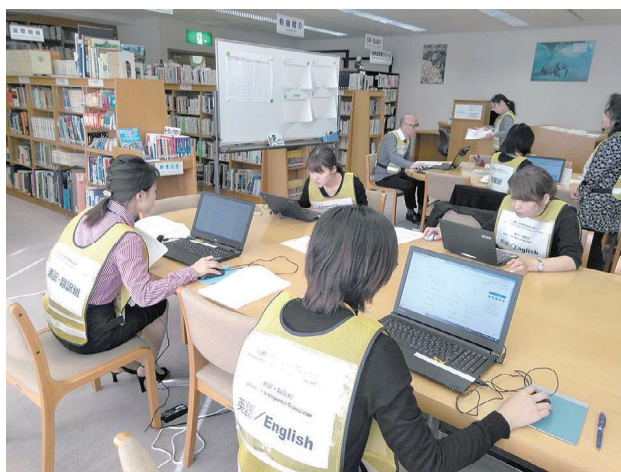
災害時多言語支援センター設置運営訓練

避難所体験では、消防署職員から、AED操作や骨折処置、応急担架づくりの指導を受けたほか、避難所を想定したシナリオに基づき、段ボールベッドやプライバシーを確保するための間仕切りの組み立てなどの実地訓練を行いました。