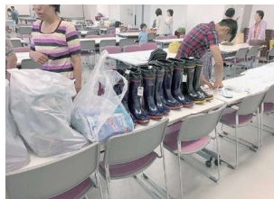
学習者のFBから一 ボランティア参加を呼びかける投稿

アンケートから、会社や同僚や友人に助けられた人が多かったこと、長く住んでいる人達は同国の友人たちを積極的にサポートしていたことが分かりました。また、会社・組合・友人・SNS・テレビ・町内放送などさまざまな方法で情報を入手していました。自宅待機が長引くと大きな収入減になるので、経済的な不安を感じている人が多かったです。そして、ボランティアに参加して手伝いたいと思っている人がたくさんいることも分かりました。