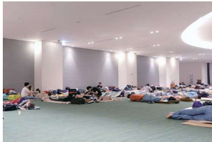
観光客向け避難所の様子

で発見された外国人被災者特有の問題や不安に適切に対処することが求められるが、この役割と責任を果たすためには、国際班とセンターが判断・指揮系統を一元化して業務にあたる必要があると重要であり、外国人観光客への対応も必要とされる今日では尚更であると考えている。今般は、こうした課題に十分に対処することができなかった。