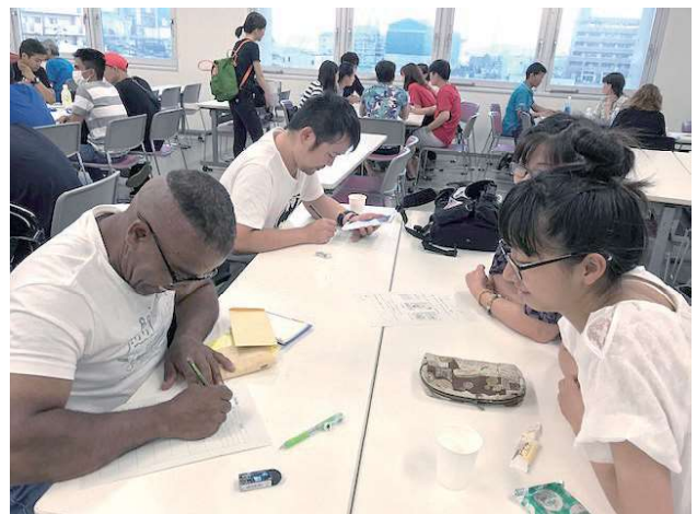
7月14日 聴き取りアンケート

8日、避難所の様子を確認するために広市民センターに向かいました。給水所の長蛇の列に日本語教室の学習者達も並んでいて、その中に家にも店にもタンクがないからと大きなポリ袋を持ったベトナム人のお母さんがいました。声をかけると、子ども連れで広島へ出かけての帰途、被害の大きかった坂町で長時間車に閉じ込められ、恐怖と親としての責任からパニックになったと、彼女は堰を切ったように話し続けました。スタッフからの報告