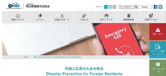
（一財）岡山県国際交流協会ホームページ

旅行者や自宅が浸水した外国人からの相談に応じたり、アパートが被災した留学生にホームステイ先の紹介などを行ったほか、被災市に対しては、市ホームページからの協会ホームページへのリンクや、被災した外国人へ提供する情報の多言語での翻訳などを行いました。