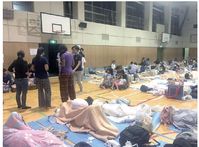
2018年6月19日の夜の巡回（左側が通訳リーダーたち @箕面市立豊川南小学校体育館）

難所である豊川南小学校を訪問したときは、9割以上が大阪大学の留学関係者だった。夜には最多の140人が避難してきたが、日本語が上手な人を「通訳リーダー」に推薦してもらい、避難所運営者との橋渡し役を担ってもらった。また、箕面市の状況が落ち着いてきた1週間後には、茨木市からの応援要請を受け、英語と中国語スタッフの通訳応援も当ネットワークで行った。