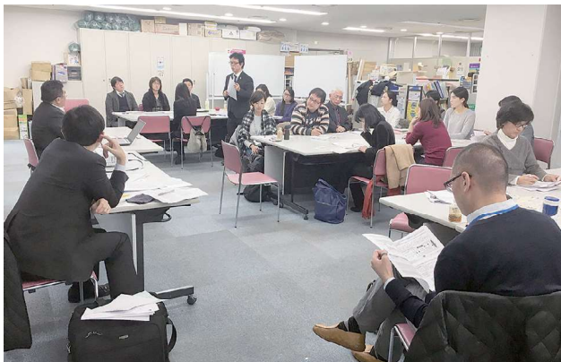
大阪弁護士会との共催による「生活困窮者自立支援制度」をめぐる研修会の様子（2018年12月14日@アイハウス）

大阪府内には、行政とともに地域の国際化を推進する団体として、12の法人格を有する国際交流協会と、16の国際交流団体がある。「国際交流協会ネットワークおおさか」の前身は、2002年度（平成14年度）に始まった「大阪発・NGOと行政をつなぐ国際交流協会ネットワーク」。以来17年間1～2カ月に一度、各団体の管理職級が参加する企画会議を持ちながら、相互にインターンシップを受け入れたり、協働で研修会を実施したりしてきた。