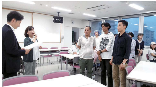
感謝状をいただきました

私達は、これからも日本語教室を参加者全員の社会参加の場とし、「仲間づくり」、「まちづくり」の活動を進めていきます。