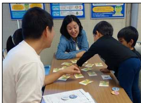
カード合わせゲームの様子