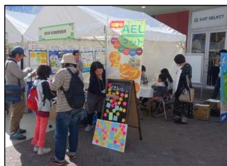
Let's エコアクションの様子

また、「知ってる? あいちのうみのコト啓発パネル」の展示、参加者による「メッセージボードへの海洋ごみ対策行動宣言の掲示」などを行い、海ごみ問題への理解を深めていただきました。