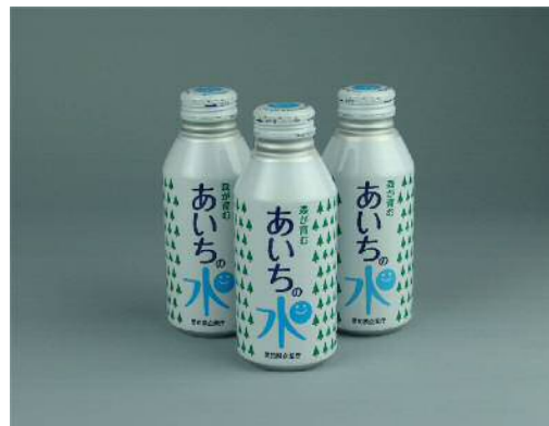
(ボトルウォーター「あいちの水」)

また、小学生（4年生以上）の親子に水道水の水源地を見てもらうための「親子ふれ愛・水源地探検ツアー」の募集チラシを関係浄水場で配布しています。行き先は、岩屋ダム及び周辺地域を予定しています。（平成31年4月25日発表済み）