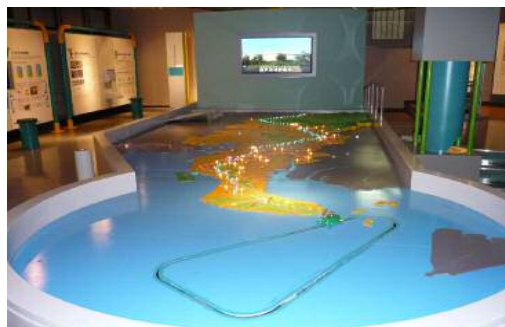
(「水の生活館」展示の様子)

水の生活館は、県営水道及び県営工業用水道に関する県営の資料館です。愛知用水が通水する以前の、水に苦勞した当時の生活用具や農業用具の展示や、水の不思議な力や働きについて