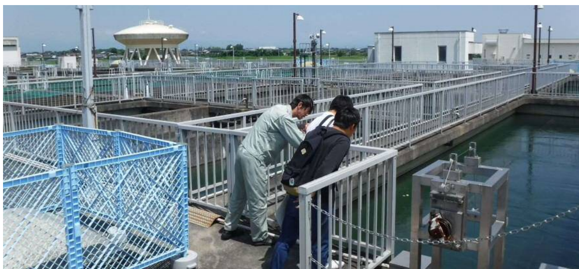
昨年度の県営浄水場一般開放の様子

https://www.pref.aichi.jp/soshiki/kigyo-suiji/suidosyukan.html