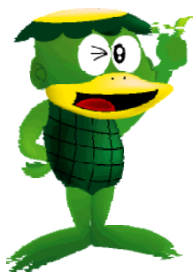
愛知県企業庁のマスコット キャラクター「カッパくん」

平成31年4月25日（木） 愛知県企業庁水道部水道事業課 浄水・水質グループ 担当 山田、東野 内線 5642、5643 ダイヤル 052-954-6683