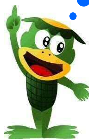
愛知県企業庁の水道マスコット キャラクター「カッパくん」