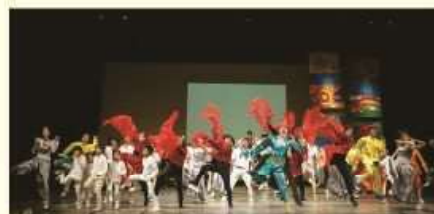
愛Wishプロジェクト 2019年11月「マカニーとエルド 2019」

http://www.aichi-artbrut.jp/ facebook powerofart16 twitter @aichiPowerOfArt