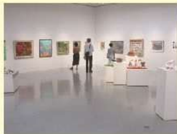
2019年9月「あいちアール・ブリュット美術館」