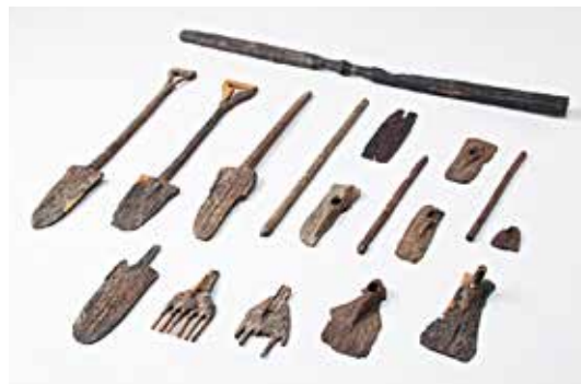
参考：朝日遺跡出土木製農具（重要文化財）

弥生時代は、水稻農耕の定着とともに各種の農具が普及していきました。これらの農具には、一昔前の道具と形がほとんど変わらないものもみられます。クワやスキは田畑を耕すために、大足（田下駄）はぬかるんだ場所での作業に、横槌はワラ打ちなどの作業に用いられました。