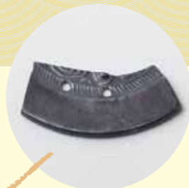
銅鏡のペンダント（破鏡）