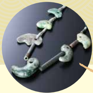
玉のペンダント（勾玉・管玉）