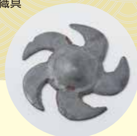
魔除けの装飾品（巴形銅器）