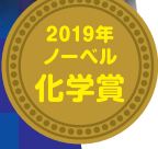
吉野 彰 Yoshino Akira