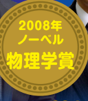
益川 敏英 Maskawa Toshihide