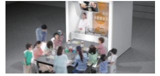
※掲載の画像は完成前のイメージです。

受賞研究をテーマとした実験やノーベルウィークの疑似体験など、受賞者やノーベル賞を多様な切り口でとらえた展示。