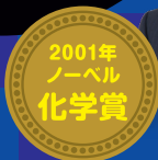
野依 良治 Noyori Ryoji