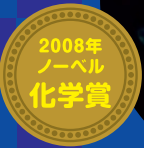
下村 脩 Shimomura Osamu