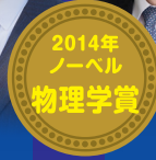
赤崎 勇 Akasaki Isamu