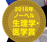
大隅 良典 Ohsumi Yoshinori