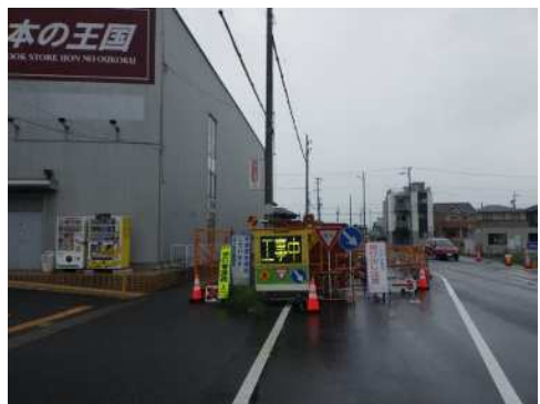
トンネル終点（本の王国さん前）