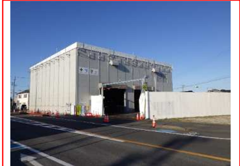
トンネル始点（ナチュラルさん前）