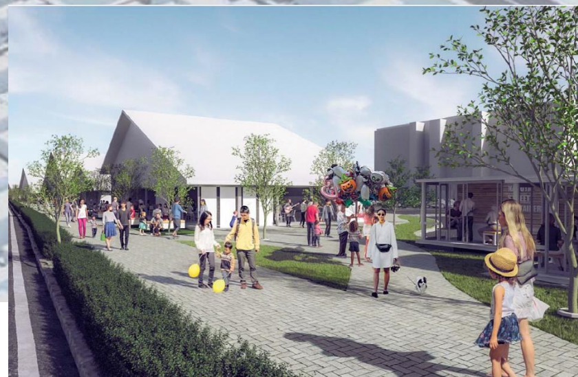
複合商業施設（東海通沿い）