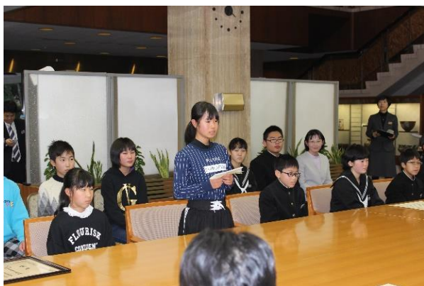
生平小学校代表の児童さんから 知事へ挨拶