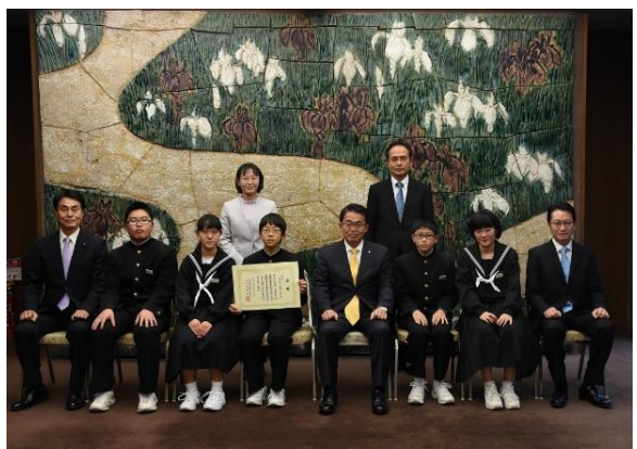
東海中学校の皆さんと記念撮影