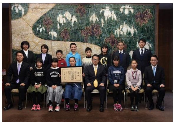
生平小学校の皆さんと記念撮影