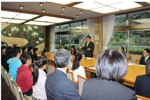
知事から受賞校の皆さんへ お祝いの言葉