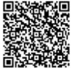
Lista de clases de japonés