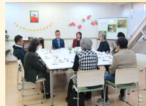
認知症ご本人交流会