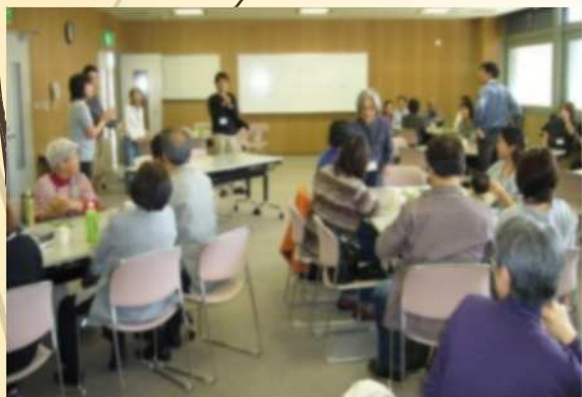
元気かい：若年本人・家族交流会 開催：土曜日