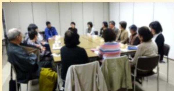
一般 (病院内4ヶ所・フロック3ヶ所) シングル：独身で親の介護 開催：土曜日・日曜日