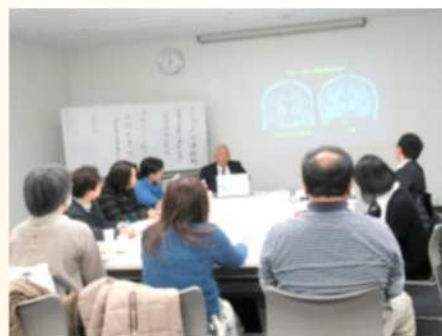
ストップザ介護離職 学習会&交流会 開催：平日 夜