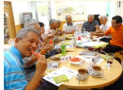
ジェントルマン：男性介護者 開催：土曜日