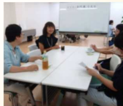
ケアラー専門職 専門職で親の介護 開催：土曜日