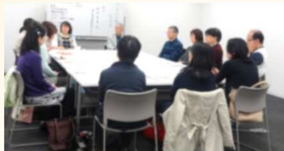
シングル：独身で親の介護 開催：日曜日